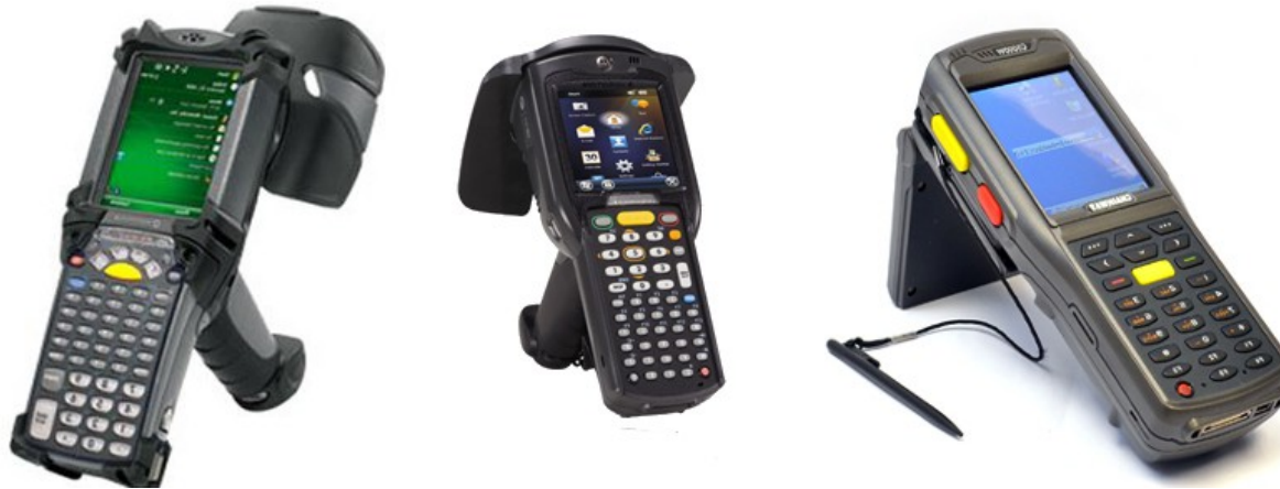
Od lewej : Kolektor danych Motorola MC9090 z modulem RFID UHF, kolektor danych Motorola MC3190 z modulem RFID UHF, kolektor danych Chainway C500U z modulem RFID UHF

Odczyt kart, tagów i breloczków RFID, identyfikacja osób, identyfikacja przedmiotów, obsługa magazynu, handel hurtowy i detaliczny, inwentaryzacja, ewidencja dokumentów.